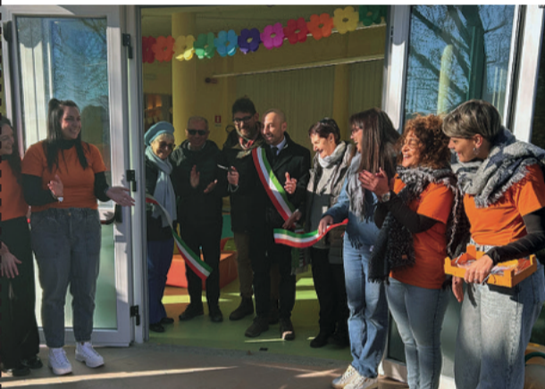
L'inaugurazione della nuova ala del micronido Alice di Drubiaglio, che si è svolta in occasione della Giornata mondiale dei diritti dell'infanzia e dell'adolescenza

Ancora pochi mesi e si vedranno i frutti del lavoro svolto sull'edilizia scolastica. Sono infatti rilevanti gli interventi programmati sulle scuole di Avigliana, a cominciare dalla primaria Italo Calvino di via Mompellato 13. Il plesso beneficia infatti del finanziamento di circa 1 milione di euro del Ministero dell'Istruzione e del Merito, fondo Protezione civile. I lavori sono stati appaltati alla fine dell'anno scolastico 2024/25 e sono finalizzati all'adeguamento sismico dell'edificio, consistente nei lavori di rinforzo strutturale dei pilastri, il rifacimento del tetto e delle pavimentazioni e, infine, la decorazione dei muri. Saranno inoltre installati i nuovi apparecchi illuminanti ed eseguiti interventi di adeguamento sui servizi igienici, ampliandoli di